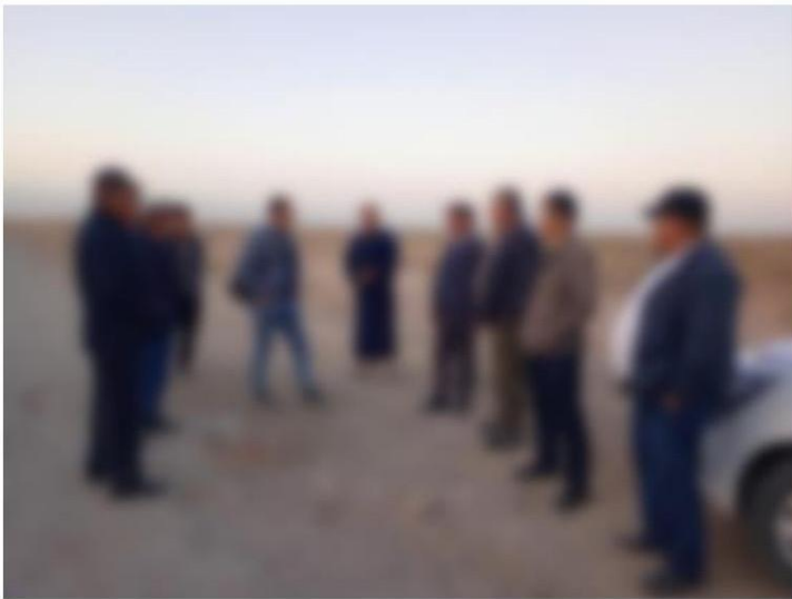
6-3-rasm. Muzrobod tumanidagi mahalla rahbarlari va qabriston vakillari bilan uchrashuv