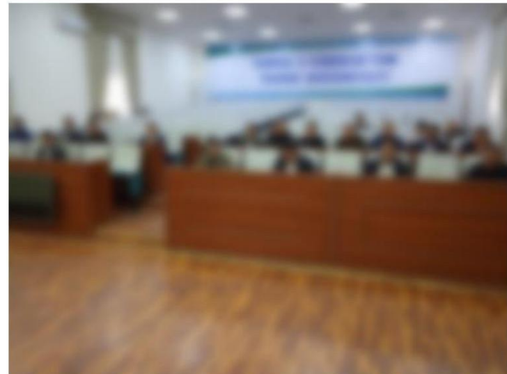
6-4-rasm. Fermerlar bilan uchrashuv