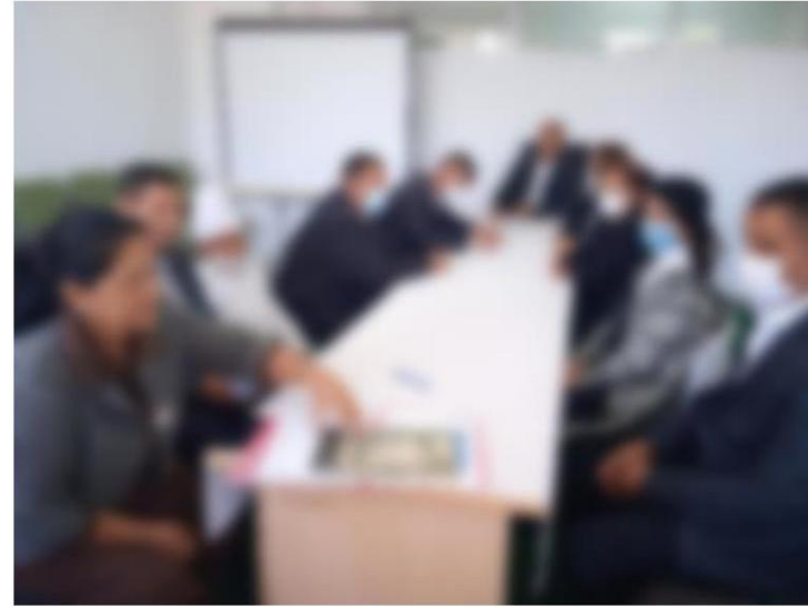
6-2-rasm. 41-maktab o'qituvchilari va ma'muriyati bilan uchrashuv