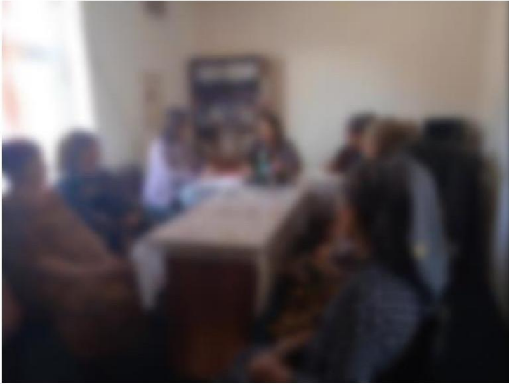
6-1-rasm Bog'obod mahallasi ayollari bilan uchrashuv